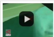
1 dari 4 Wanita Terkena ...