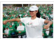
Hari Osteoporosis Nasional