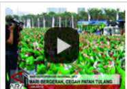
Mari Bergerak, Cegah Patah ...